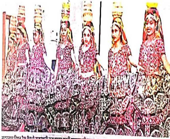
सुंदरनगर स्थित रैफ कैम्प में राजस्थानी नृत्य प्रस्तुत करती कस्तूरवा की छात्राएं