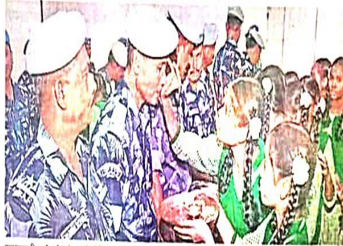
सुंदरनगर स्थित रैफ कैम्प में जवानों को तिलक लगाकर राखी बांधती कस्तूरवा विद्यालय की छात्राएं

में शामिल सभी छात्राओं को प्रतिभा के कायल जवान हुए। इसके बाद संघोधन का सिलसिला प्रारंभ हुआ। बाद में सभी छात्राओं एवं ब्रह्मकुमारों की बहनों ने जवानों को राखी बांधी। कार्यक्रम में दैनिक जागरण जमशेदपुर के वरिय पदाधिकारियों ने